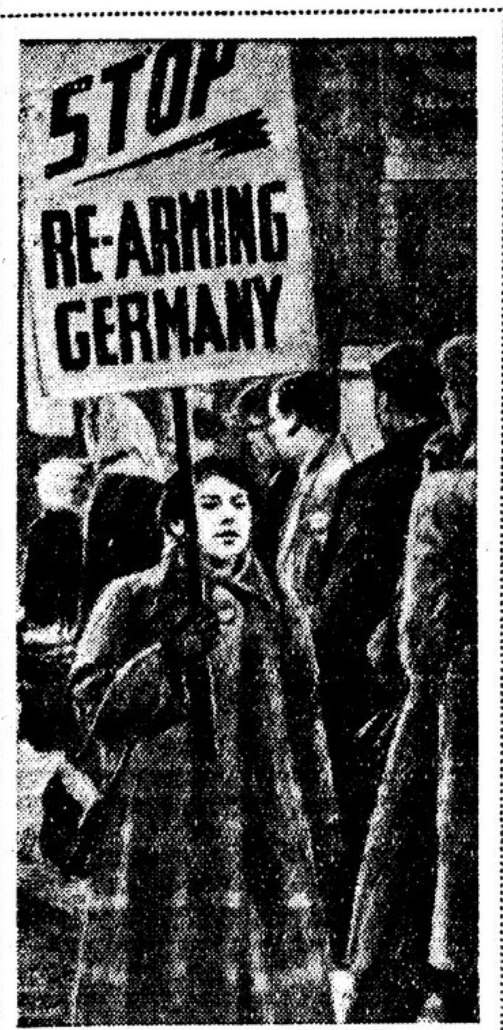
В Англии принимает все более широкие размеры движение протеста против реармации Германии. На снимке: демонстрация, устроенная сторонниками мира на улицах города Вудфорда. Демонстрантка несет плакат с надписью: «Прекратите перевооружение Германии».